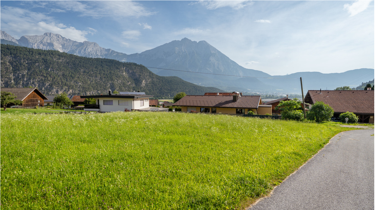
Sicht nach Osten