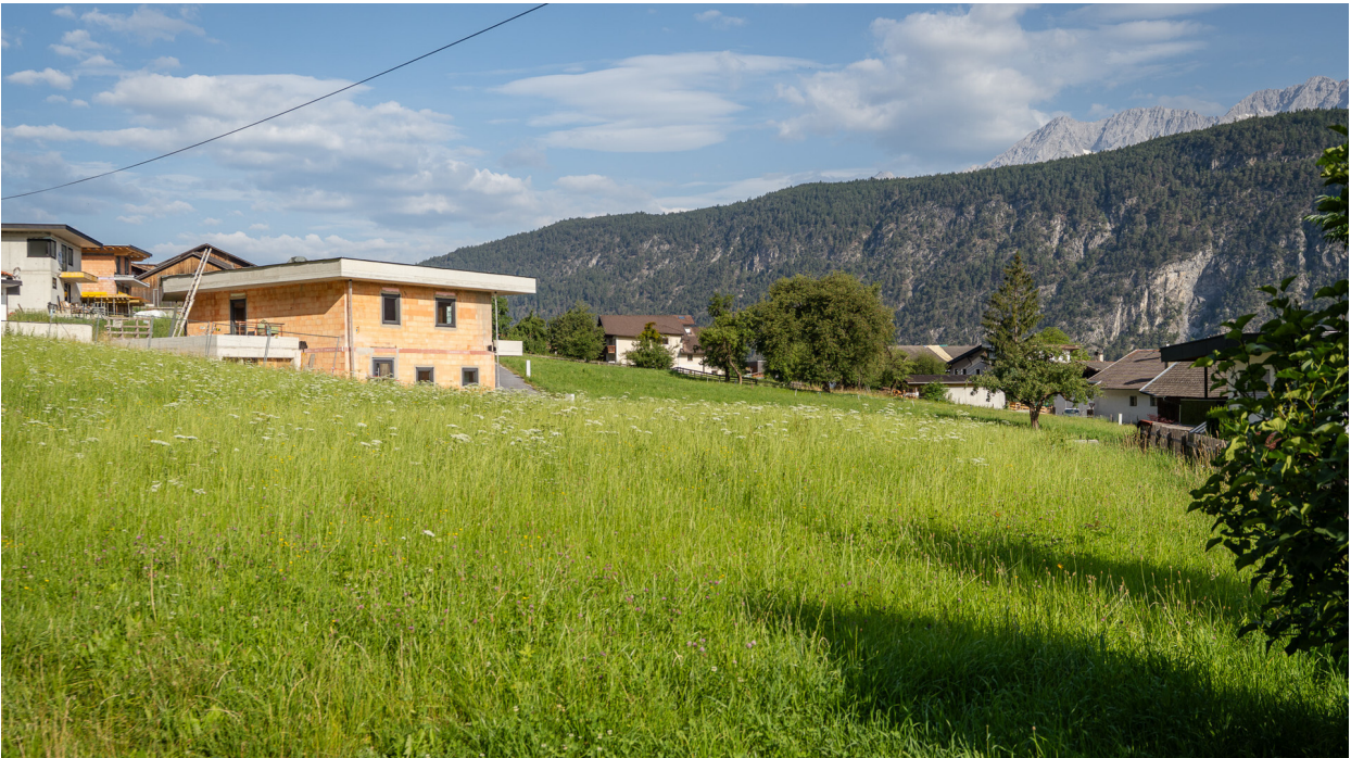
Sicht nach Norden_Westen