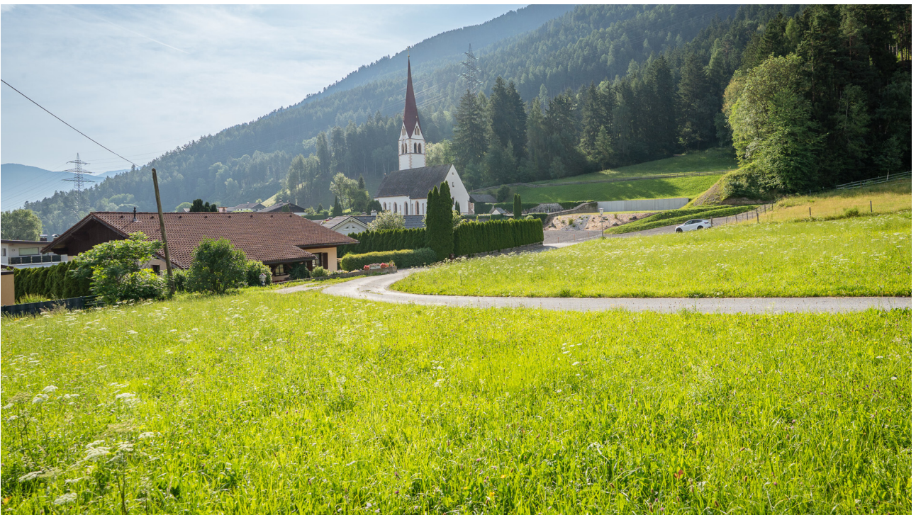
Sicht nach Süden